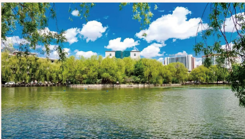
封底图片